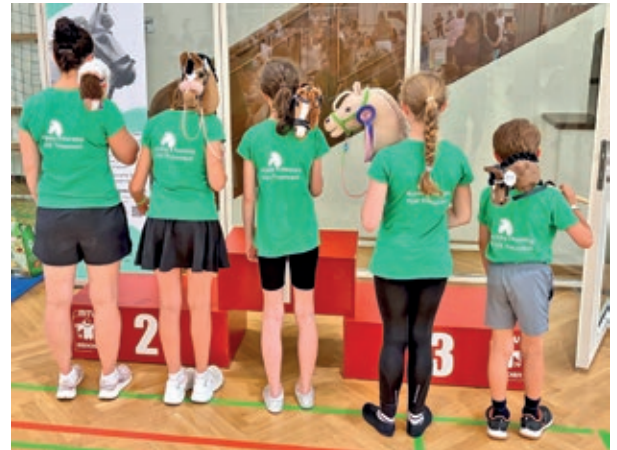
Text, Foto: Tus Traunreut, Hobby Horse

Der Ausflug hinterließ bei allen Teilnehmenden bleibende Eindrücke und viele neue Inspirationen für den eigenen Garten.