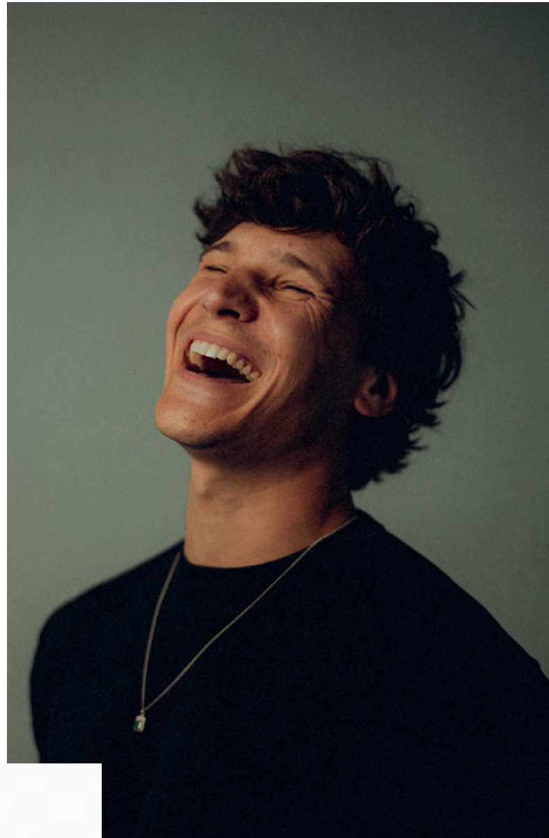
Wincent Weiss & Lina sorgen für den perfekten Sommerabend im Traunreuter Freibad.

Am Freitag, 7. August, folgt dann ein ganz anderer Ton, aber nicht weniger intensiv. Wincent Weiss kommt mit seiner Sommertour nach Traunreut und bringt gemeinsam mit LINA einen Konzertabend ins Freibad, bei dem vermutlich spätestens beim ersten Refrain mehrere hundert Menschen gleichzeitig textsicher werden – „Da müsste Musik sein!“