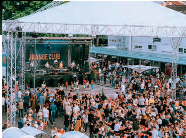
Das Traunreuter Stadtfest ist weit über die Grenzen der Stadt hinaus bekannt und beliebt.

Neben den Bühnen entfalten sich weitere Bereiche in der Innenstadt. Familien erwartet ein Kinderprogramm mit Clown, Riesenseifenblasen, Kinderschminken, Bungee-Anlage und Hindernisparcours. Ein Boulderwürfel bringt Bewegung in den öffentlichen Raum, während das Tragerkraxeln des Technischen Hilfswerkes seit Jahren zu den festen Publikumsmagneten zählt.