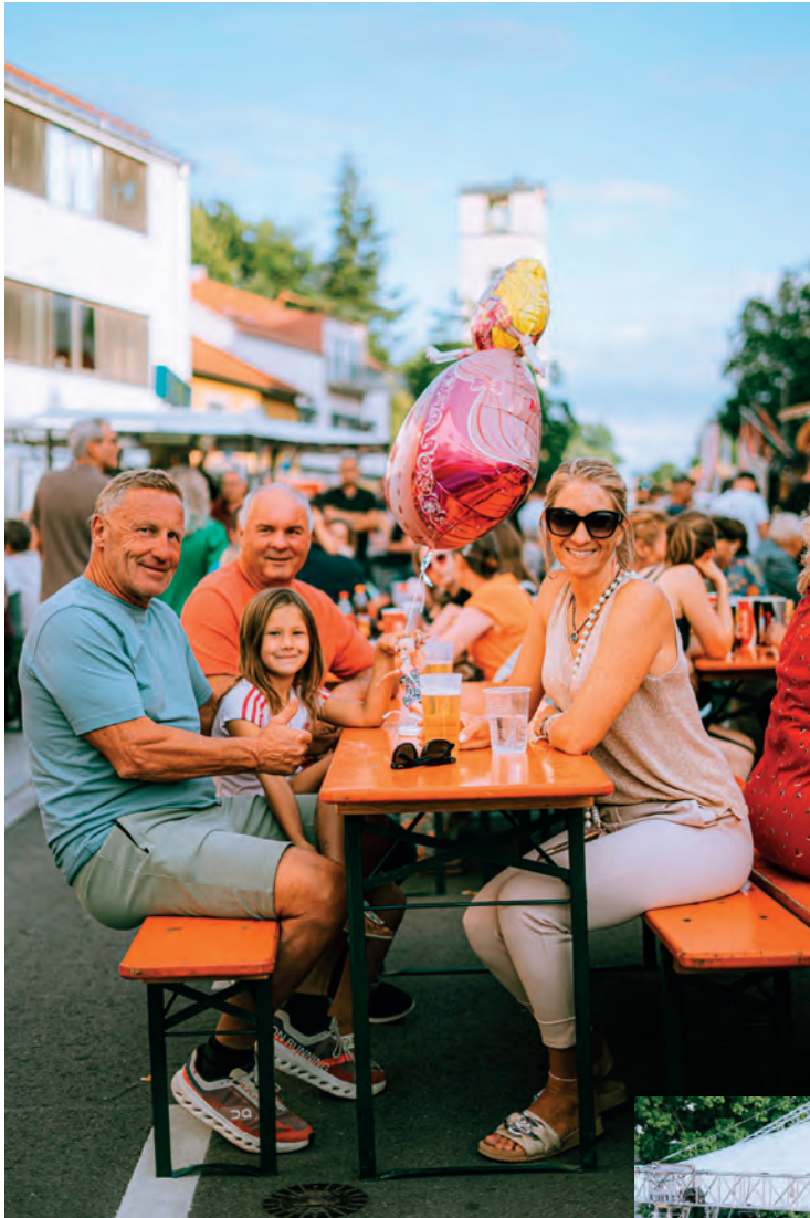
Ein Fest für alle Generationen, das Traunreuter Stadtfest.

Am Samstag, 11. Juli 2026, zieht wieder Leben in die Traunreuter Innenstadt ein: Ab 15 Uhr verwandelt das Stadtfest die Straßen und Plätze im Zentrum in eine große Festmeile mit Musik, Tanz, Kulinarik, Sport und vielen Angeboten für die ganze Familie. Der Eintritt ist frei.