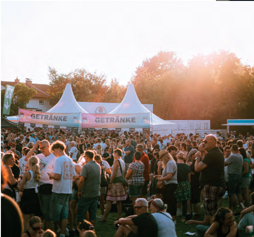
Geheimtipp Bergflair Open Air – ein Festival für alle Generationen zum Ferienstart.

Und am Samstag, 8. August, gehört die Bühne einer Generation von Künstlerinnen und Künstlern, die gerade dabei ist, die deutschsprachige Poplandschaft neu zu sortieren. Berg, Bruckner und Emma Rose bringen Songs mit, die irgendwo zwischen Indie, Pop und dem Gefühl liegen, diese Nacht soll einfach nicht enden.