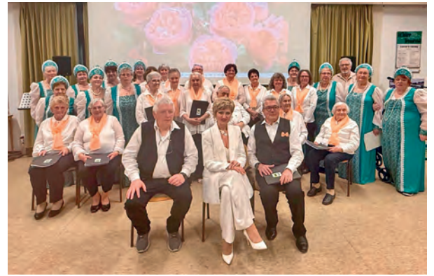
Text, Foto: Banater Schwaben

Anschließend führte die Wanderung weiter in die Au, wo die Gruppe nicht nur weitere Kräuter, sondern auch die jungen Blätter von Linde und Buche sowie die frischen Fichtenspitzen kennenlernte. Neben der Bestimmung standen dabei vor allem Geschmack und Verwendungsmöglichkeiten im Mittelpunkt. Viele staunten, wie aromatisch junge Baumblätter sein können und wie vielseitig Fichtenspitzen in der Küche eingesetzt werden. Mit gut gefüllten Körben ging es zurück zum Ausgangspunkt, wo gemeinsam ein kleines Wildkräuter Menü entstand. Während ein Teil der Gruppe die gesammelten Schätze zu Köstlichkeiten wie einem Wildkräutersalat mit Bärlauchknospen oder einer Wildkräuterquiche verarbeitete, stellten sich die übrigen Teilnehmer einem Gartenquiz. Dabei galt es, Wildkräuter im Garten zu finden und richtig zuzuordnen – eine Herausforderung, die mit viel Lachen und Einsatz gemeistert wurde. Zum süßen Abschluss gab es Vanilleeis mit schokolierten Blättern. Besonders die in weißer oder dunkler Schokolade getauchten Fichtenspitzen sorgten für Überraschung: Viele entdeckten sie als echten Geheimtipp und neuen Lieblingssnack. Die Wildkräuterwanderung bot damit nicht nur kulinarische Inspiration, sondern zeigte einmal mehr, wie viel Genuss direkt vor der Haustür wächst.