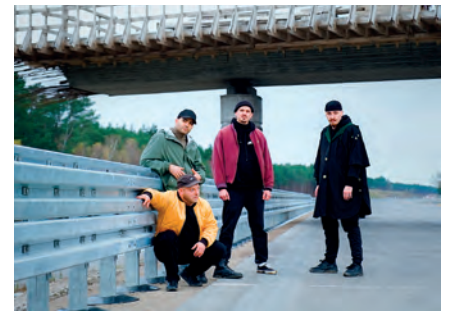
The Razzzones

Tickets sind telefonisch unter +49 8669 857-444 oder direkt vor Ort im k1 erhältlich – jeweils von Mittwoch bis Freitag zwischen 11:00 und 15:00 Uhr und Samstag 10:00 - 14:00 Uhr. Online-Buchungen sind jederzeit unter www.k1-traunreut.de möglich. Die Abendkasse öffnet in der Regel eine Stunde vor Veranstaltungsbeginn.