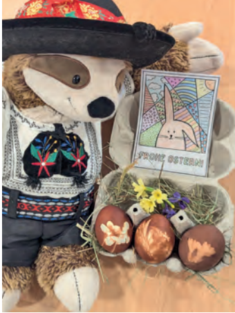
Traditionelle Färbetechnik aus Siebenbürgen

In Traunreut wurde es am Freitag, den 27. April 2026, wieder bunt: Die Kindertanzgruppe der Siebenbürger Sachsen lud zum traditionellen Ostereierfärben eingeladen – und viele kleine Künstler folgten begeistert dieser Einladung.