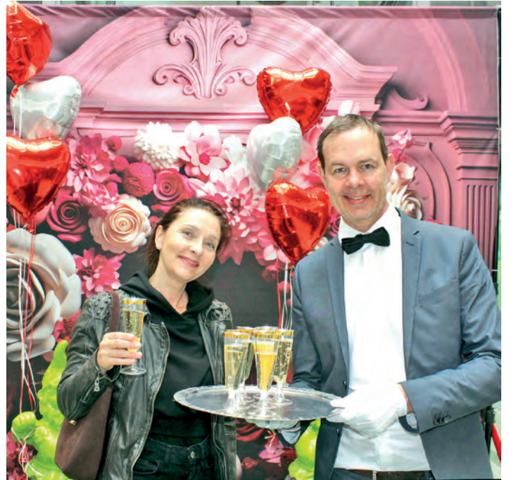
Davon träumen viele Mamas: Ein elegant gekleideter Butler überreicht ihnen am 7. Mai – kurz vor dem Muttertag - in der Traunpassage eine kleine Überraschung. Mit einem Lächeln...

Das Einkaufserlebnis ist am 7. Mai perfekt: geschützt unter einem Dach wartet auf die Kunden eine große Sortimentsauswahl. Daneben lockt die Vielzahl von kostenlosen Parkplätzen, die man mit Parkscheibe drei Stunden sorglos nutzen kann. Bei einem längeren Einkaufsbummel ist es selbstverständlich möglich, die Parkscheibe nachzustellen. Das besondere Gläschen zum Anstoßen wartet auf alle Mamas zwischen 13 und 19 Uhr.