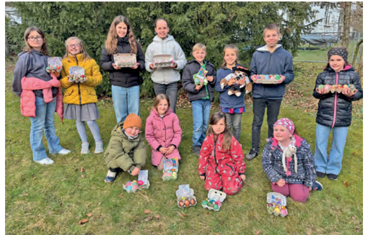
Teilnehmer beim Ostereierfärben

Mit viel Freude und noch mehr Farbe verwandelten die Kinder einfache Eier in kleine Kunstwerke. Ob marmoriert, beklebt oder klassisch gefärbt – jede Technik fand ihren Platz und sorgte für strahlende Gesichter. Für die älteren Kinder gab es ein besonderes Highlight: Sie durften eine traditionelle siebenbürgische Färbemethode ausprobieren. Dafür wurden die Eier mit einer Pflanze ihrer Wahl in einen Seidenstrumpf gewickelt und anschließend zusammen mit Zwiebelschalen gekocht. Das Ergebnis waren kunstvolle Naturmuster, die für Staunen und echte Aha Momente sorgten. Am Ende blickten alle auf einen gelungenen Nachmittag zurück – voller Kreativität, fröhlicher Begegnungen und natürlich wunderschön gefärbter Ostereier. Ein Erlebnis, das sicher noch lange in Erinnerung bleibt.