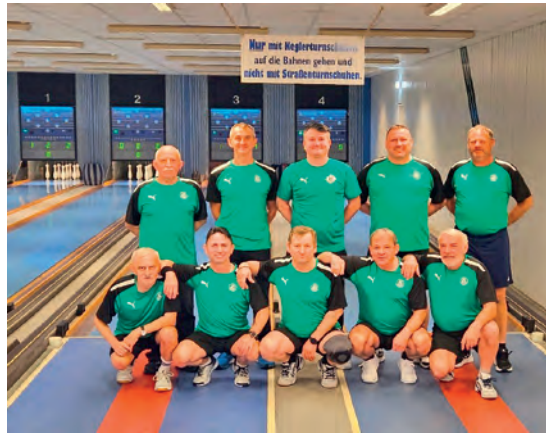
Auszug aus der Abteilung

Auch für Hobbykegler oder Kindergeburtstage ist selbstverständlich Zeit und Raum. Donnerstags ab 19:00 Uhr, jeden 4. Samstag