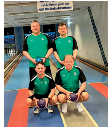
Saisonmeister der Kreisklasse

(KW 18/22/26 usw.) und an Mittwochen kann nach Reservierung gekegelt werden.