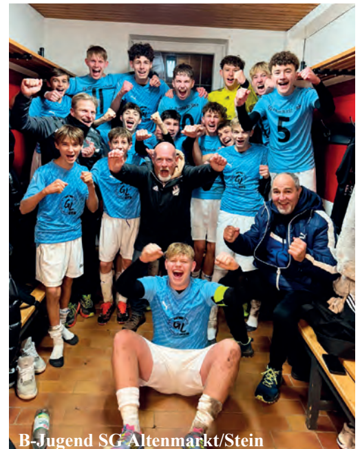
B-Jugend SG Altenmarkt/Stein