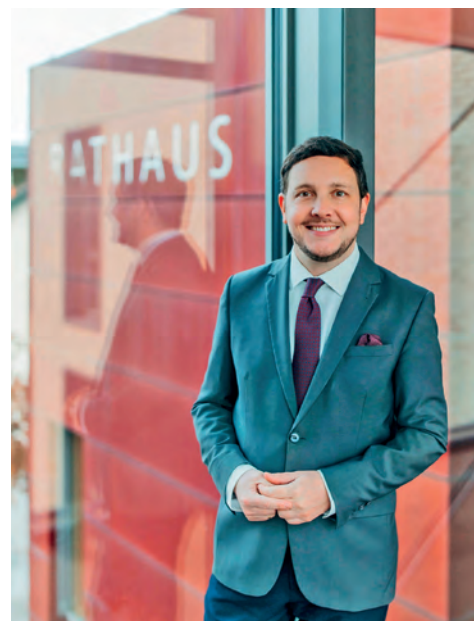
Hans-Peter Dangschat, Erster Bürgermeister der Stadt Traunreut

Ihr Hans-Peter Dangschat, Erster Bürgermeister der Stadt Traunreut