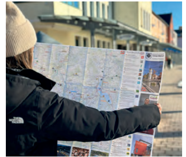
Aktiv in und um Traunreut: Der neue Stadtplan beinhaltet viele Tourenvorschläge.

Der Stadtplan ist vollständig werbefinanziert, sodass der Stadt keine zusätzlichen Kosten entstanden sind. Er liegt ab sofort im Rathaus aus und kann dort kostenfrei abgeholt werden.