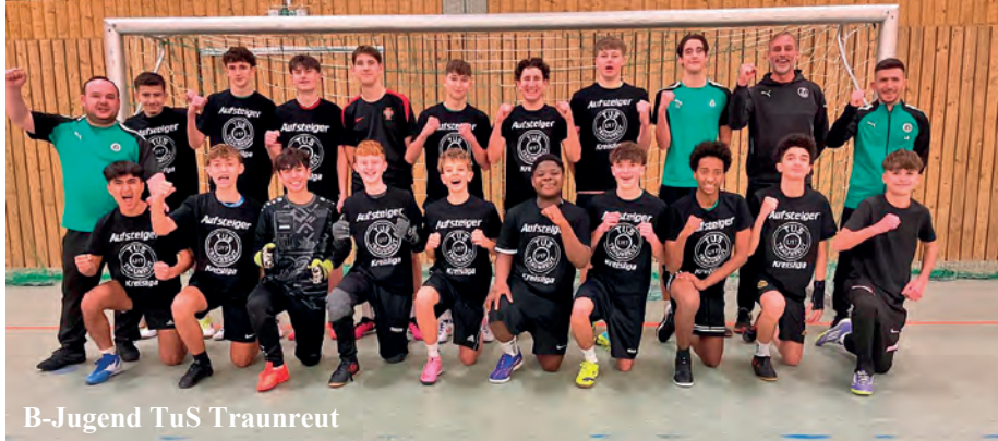
B-Jugend TuS Traunreut

Aufstieg gelungen: Nach einer herausfordernden Saison hat sich die B-Jugend SG Altenmarkt/Stein dank solider Spielleistung mit 22 Punkten den 1. Platz auf der Tabelle der Kreisklasse in der Gruppe 2 Inn/ Salzach HR gesichert und steigt damit in die Kreisliga auf. Den 2. Platz erreichte TuS Traunreut mit 20. Punkten und freut sich somit ebenfalls über den Aufstieg.