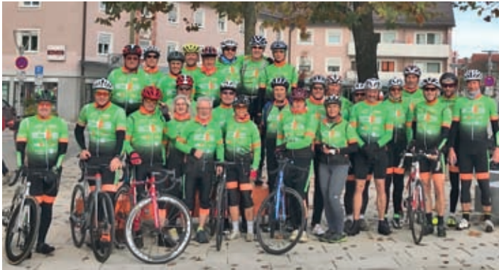
Text, Foto: RSV

beim Radsportverein Traunreut e.V. am 18. und 20. Oktober