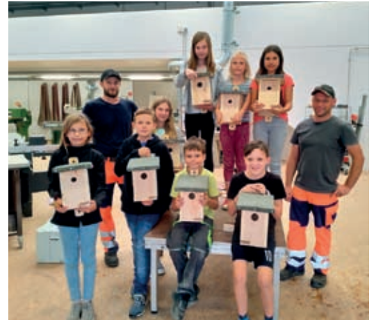
Bei der Aktion im städtischen Bauhof haben die Kinder tolle Vogelhäuschen gebaut.

Das Programm selbst startete traditionell mit dem Kinder- und Familienfest am 21. Juli im Traunreuter Franz-Haberlander-Freibad und endete am 14. Oktober mit dem Besuch der Heidenhain Sternwarte . Zusammen mit der Initiativgruppe freut sich die Stadt schon heute über die vielen Zusagen, die die Veranstalter am Abend für das nächste Jahr gegeben haben. Damit auch im nächsten Jahr wieder ein tolles Programm für die Kinder und Familien zusammengestellt werden kann.