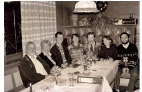
Stammtisch der BÜRGERLISTE 1996

>> noch viele andere neue Themen auf die Stadt zukommen. Er komme aus dem Sportbereich und will die politische Arbeit im Team angehen und als Mannschaftsleistung verstanden wissen. Ausgrenzung gehe in der Kommunalpolitik gar nicht. Er wäre auch dafür, die Stadtratssitzungen einer größeren Menge von Zuhörern zu öffnen und die Bürger bei bestimmten Fragen miteinzuverbinden. Abschließend sagte Gorzel, dass man auf dem Land wohne wie im Paradies und so möge es auch bleiben.