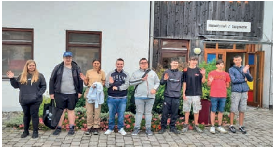
Unsere neuen Azubis auf dem Ausbildungsgelände der Adalbert-Stifter-Straße 29

Zeitgleich zur Ausbildung startete zudem für 16 Jugendliche die Berufsvorbereitende Bildungsmaßnahme innerhalb der Jugendsiedlung. Diese bietet im Rahmen von elf Monaten Orientierung