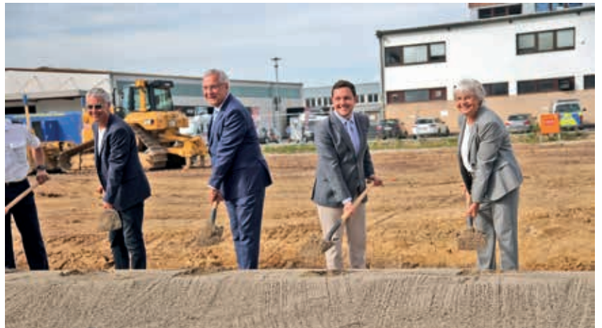
Text: Innenministerium

In Zusammenarbeit mit Grütter Buch + Spiel verlosen wir ein Exemplar. Teilnahme per Email an redaktion@traunreuter-stadtblatt.de oder auf Facebook und Instagram. Teilnahme-schluss ist der 15. Oktober. Der Gewinner wird benachrichtigt und kann anschließend seinen Gewinn bei Grütter Buch + Spiel , Kanstraße 4 in Traunreut abholen.