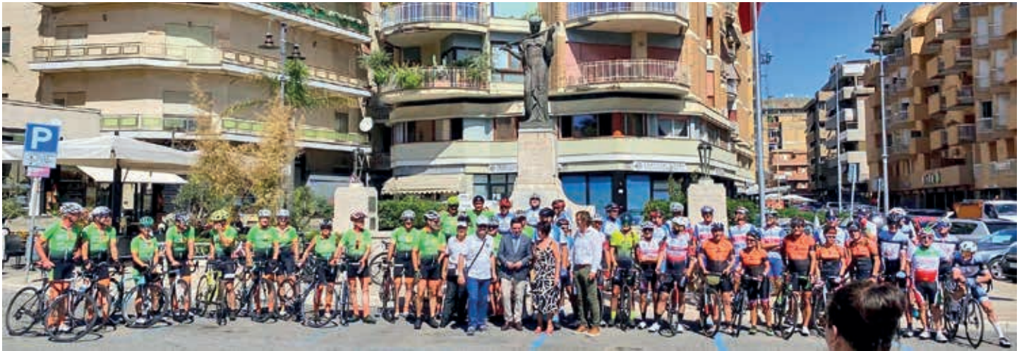
Text + Foto: RSV Traunreut e.V.