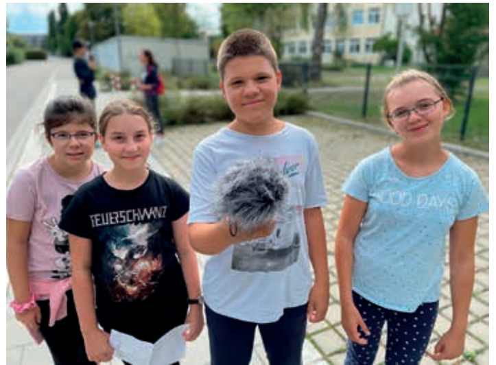
Radio JuZ Traunreut

Gleich Anfang August war der Bus in den Bayernpark gewohnt voll. Besonders beliebt waren auch tierische Angebote - vom Kameltrekking im Mangfalltal über die Pferdetage auf Schloss Perenstein bis hin zum Besuch des Wildparks Oberreith. Ihr handwerkliches Geschick zeigten die Traunreuter Kinder zum Beispiel bei der ausgebuchten Holzwerkstatt vom Trachtenverein Traunwalchen oder bei der Aktion „Schnitzen, Knoten, Feuer machen“ der Evangelischen Kirche Traunreut. Die heimischen Sportvereine präsentierten sich unter anderem in den Disziplinen Selbstver-