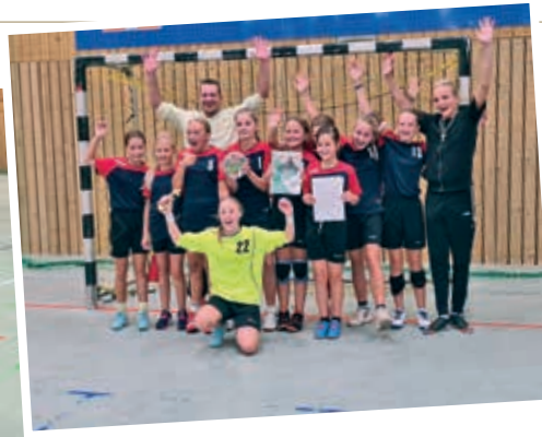
Text: Licinac