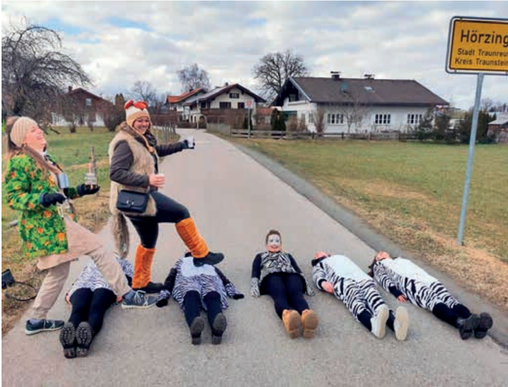
Endlich hat Hörzing den lang- ersehnten Zebrastreifen bekommen!