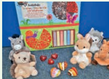
Angesagt: die Glitzer-Straßenkreide mit Schablonen