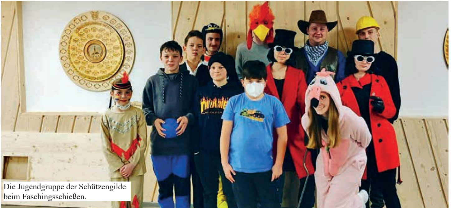
Die Jugendgruppe der Schützengilde beim Faschingschießen.