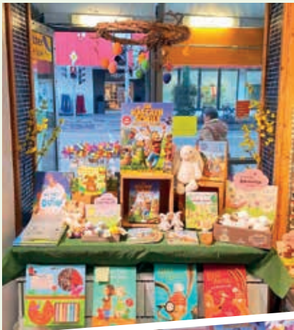
Ein Ostertisch mit Büchern und Spielen für kleine und große Kinder

Alle Geschenke erhältlich bei: Grütter Buch + Spiel in Traunreut