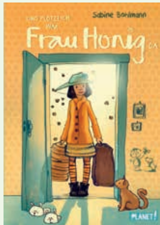
Ein wunderschöner honiggelber und unvergesslicher Sommer beginnt ...

Alle Geschenke erhältlich bei: Grütter Buch + Spiel in Traunreut