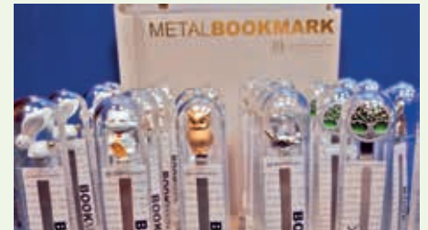
Originelle Lesezeichen sind immer ein Hingucker im Osternest.