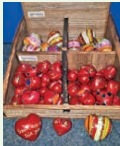
Frühlings-Pflanzstecker aus Keramik, erhältlich sind Hasen, Frösche, Schnecken, Vögel. Die Specksteinherzen sind absolute Handschmeichler.