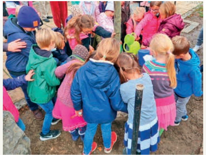
Kinder der Grundschule Gräfelfing gießen den frisch gepflanzten Baum, Foto: Kunstkreis Gräfelfing.

Wer selber an einer Pflanzaktion teilnehmen möchte, hat demnächst die Möglichkeit in Weiden, Polling und - ganz in der Nähe - in Übersee. Weitere Infos unter www.dasmaximum.com