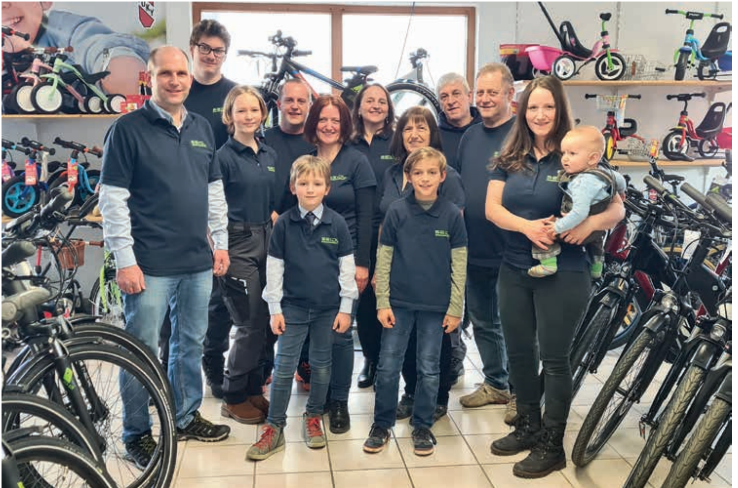
Das Team des Seidl Zweiradgeschäfts freut sich auf die Jubiläumsfeier mit vielen Aktionen.