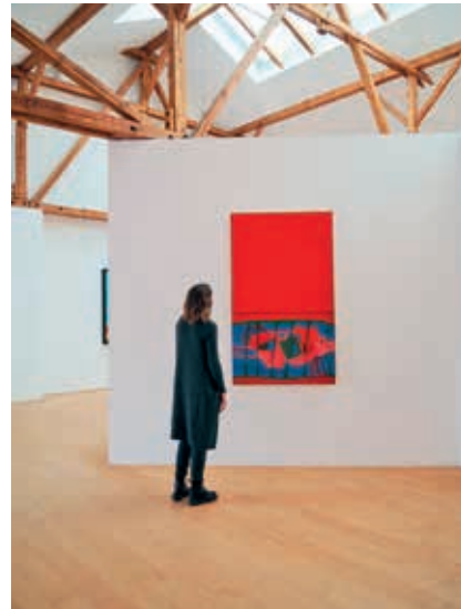
Lausen Saal mit Rot, 1964

nicht ausgestellte Werke des deutschen Malers Uwe Lausen vorbereitet: Das ungewöhnliche, aus zwei Leinwänden bestehende Gemälde „Rot“ zeigt eine von Lausens typischen frühen