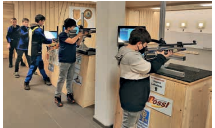
Ein Teil der neuen Jugendgruppe beim Training mit Licht- und Luftgewehr

Die Jugendgruppe der Schützengilde ist Mitglied im Kreisjugendring Traunstein und betreibt auch allgemeine Jugendarbeit, während der Schießsaison von Oktober bis April liegt das Hauptaugenmerk aber auf der schießsportlichen Ausbildung, die Ausrüstung wird dabei komplett vom Verein gestellt. Natürlich kommt auch der Spaß nicht zu kurz. Mit den Elektronischen Schießständen und dem vereinseigenen Jugendraum mit Kicker und Dart, stehen dazu im Schützenheim in Oderberg nahezu optimale Bedingungen zur Verfügung. Durch ein Förderprogramm der Deutschen Stiftung für Engagement und Ehrenamt kürzlich zwei neue Laserstände für Lichtgewehr und Lichtpistole angeschafft werden, sodass nun auch für Kinder unter 12 Jahren ausreichende Kapazitäten vorhanden sind. Das Training findet jeden Donnerstag um 18:30 Uhr im Schützenheim in Oderberg statt und kann jederzeit auch von Neueinsteigern besucht werden.